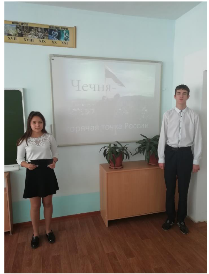
«Чечня - горячая точка России»

Данный проект посвящен открытию школьных музеев – центра патриотического и гражданского воспитания, проект направлен на создание эффективных моделей духовно-нравственного и гражданско-патриотического воспитания. История прошлого – это память народов. В ней наши корни, корни сегодняшних явлений. История хранит в себе опыт поколений, великие имена, подвиги людей и многое другое. Это история наших дедов и прадедов. Если человек не знает истории своего народа, не любит и не уважает её культурные традиции, то вряд ли его можно назвать достойным гражданином своего отечества. Главный инструмент сохранения исторического прошлого является музей. Именно он позволяет собрать, систематизировать и сохранить следы прошлых лет.