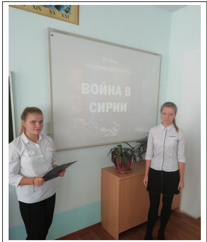
«Войны-Интернационалисты. Война в Сирии»