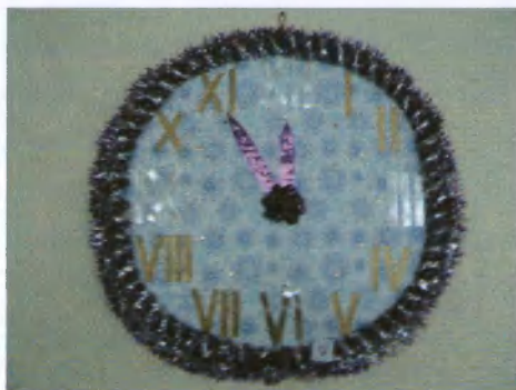
Максимцева О.Н.