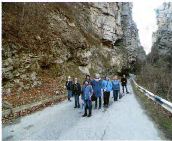
Канатная дорога в г. Нальчик