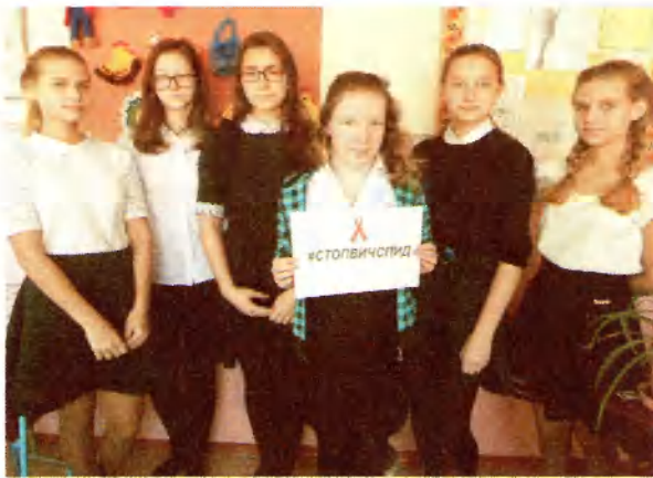
Спецкор Бякин Владимир, фото учащихся